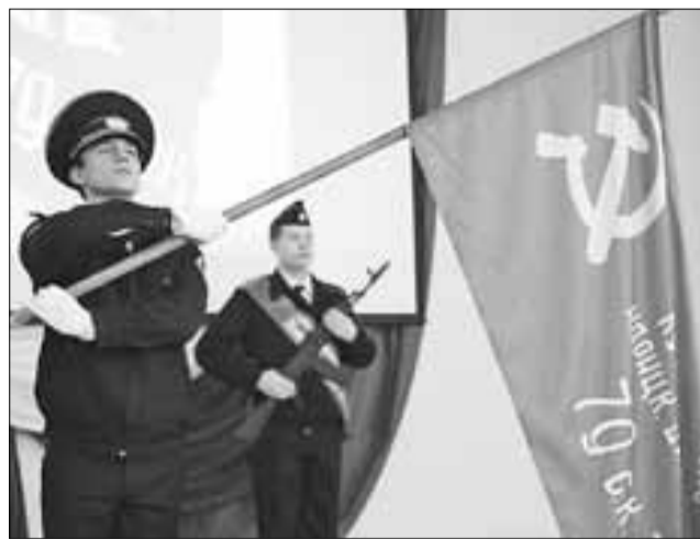
■ Копия знаменитого стяга уже побывала во многих городских школах.

– Мы долго думали, как нам подготовиться к при-