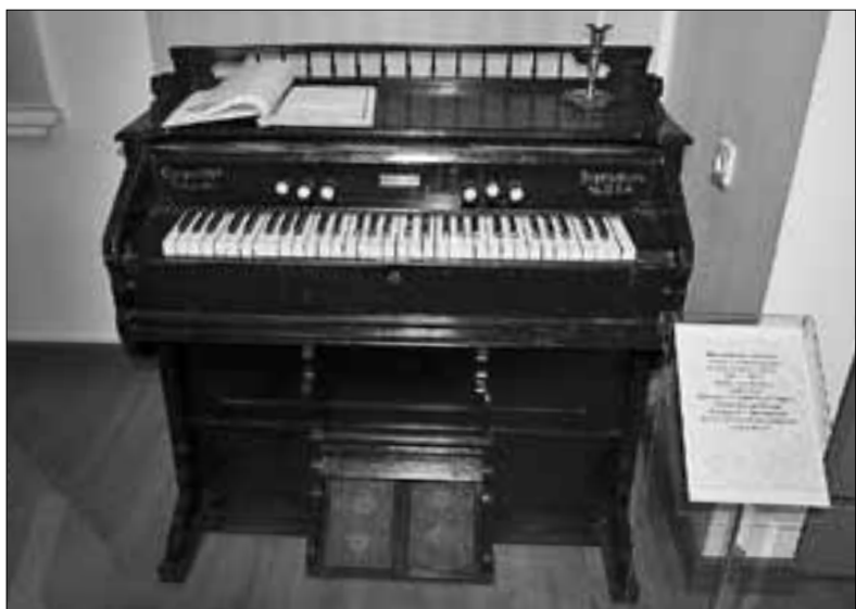
■ Фисгармония конца XIX – начала XX веков

Старинные инструменты и музыкальные аппараты в музее можно не только увидеть, но и услышать – разумеется, в записи. Выставка «Музыка. Время. Пространство» будет работать до конца июня 2018 года.