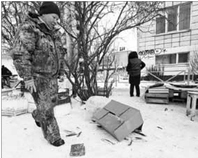
■ Рыба на улице продается с нарушением всех санитарных правил

ровская, госинспектор Россельхознадзора. – На моей практике за пять лет работы документы на изъятую продукцию предоставили всего один раз.