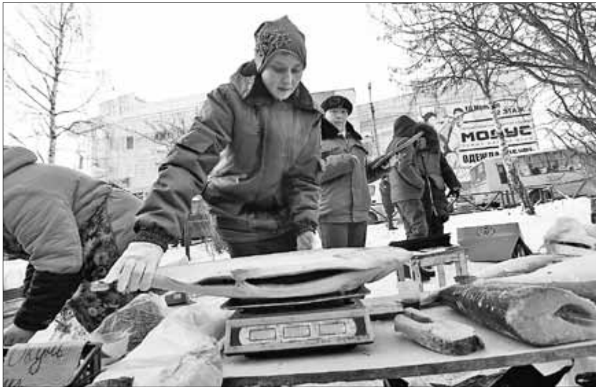
■ Сотрудники Россельхознадзора «каrestовывают» рыбу