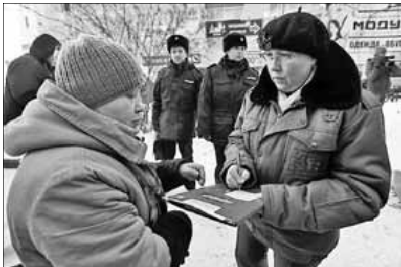
■ За нарушение правил торговли предусмотрена ответственность