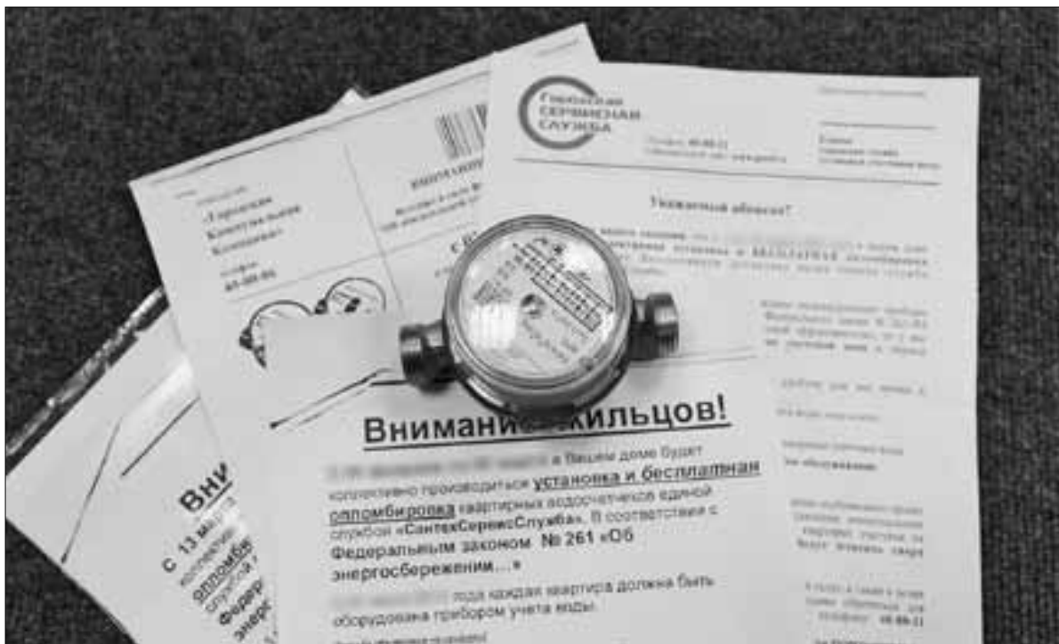
Подобным извещениям самое место в урне.

В ЦСМ организации типа «Единая городская служба по учету водоснабжения», «Водоконтроль. Городская служба по учету водоснабжения», «Единый городской центр обслуживания ЖКХ» относят к мошенническим. Их точные адреса на бланках отсутствуют, и в нашем ре-