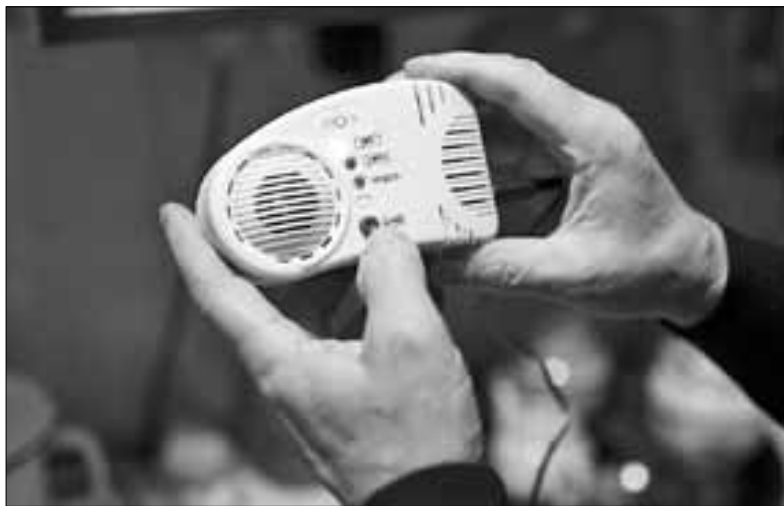
Газоанализатор обошелся в тридорога.

Жертвами нечистоплотного бизнеса чаще становятся пенсионеры