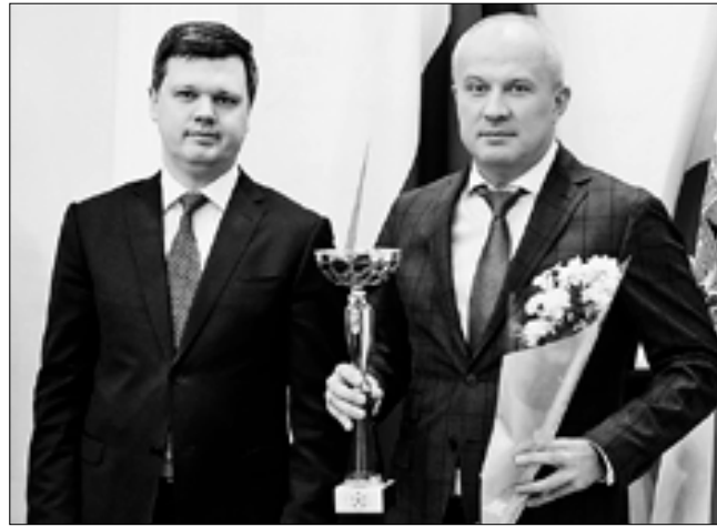
Представители предприятий Архангельской области получили заслуженные награды за качество своих товаров и услуг.

Знай наших: Определены победители регионального конкурса «Архангельское качество» и Всероссийского конкурса «100 лучших товаров России»