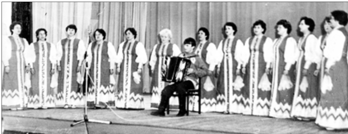
Сорок лет назад в Доме культуры поселка Первых пятилеток был организован кружок «Северяночка».