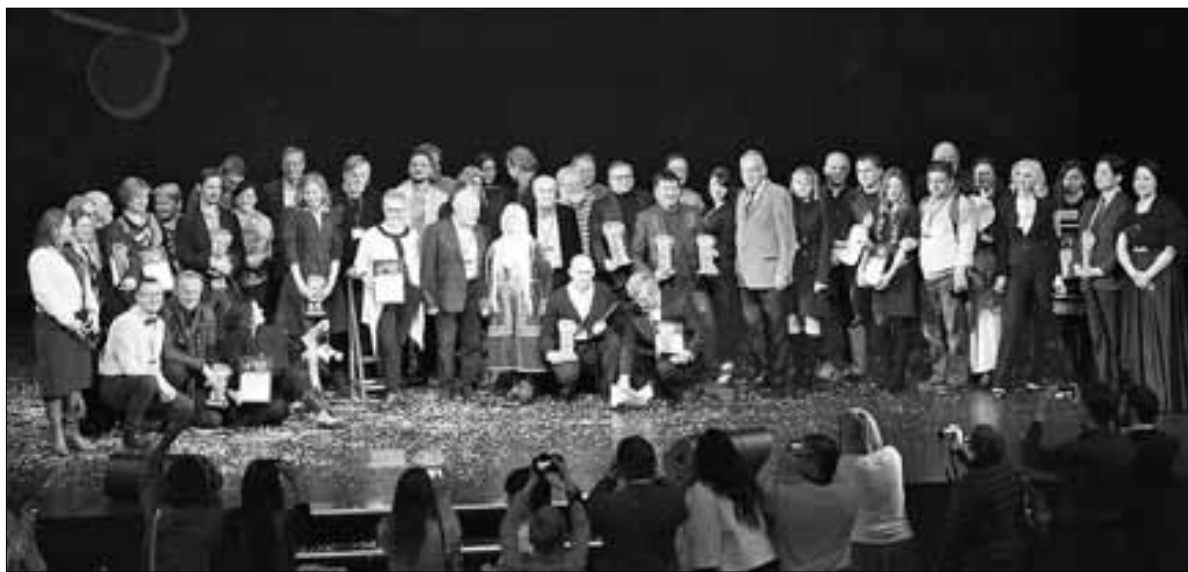
■ Церемония награждения победителей прошла в театре драмы.

Действие трагикомедии «Жили-были» происходит в заброшенной деревушке, где живут два одиноких старика и вдова. Один из стариков решает предложить женщине руку и сердце, но второй с этим не согласен и тоже претендует на вакантное место. Они объявляют друг другу войну... Блистательная игра Федора Добронравова, Романа Мадянова и Ирины Розановой стала украшением фильма.