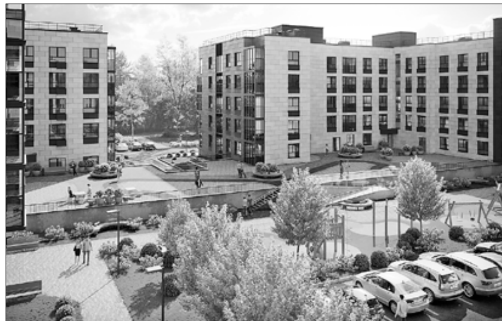
■ Проект квартала 007 в Северодвинске

В декабре Группа Аквилон приступает к строительству сразу двух новых жилых комплексов. В Северодвинске в квартале 007 на месте расселенных застройщиком домов возводится ЖК «Аквилон SEVEN». На улице Нагорной в Архангельске будет построен современный жилой комплекс с помещениями общественно-делового назначения.