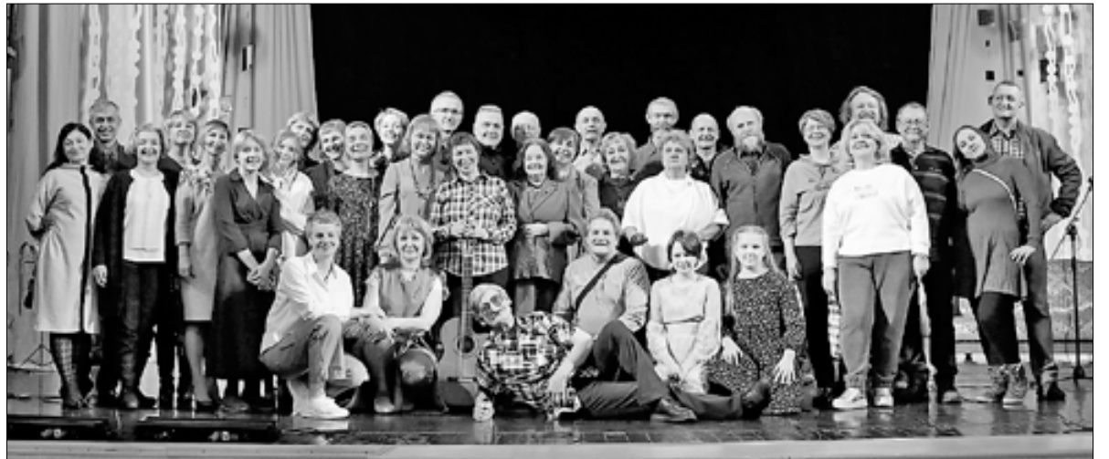
■ Юбилейный концерт клуба авторской песни «Вертикаль» на сцене АГКЦ

– Главная особенность фестиваля бардовской песни – это творческие мастерские. На них происходит общение с другими участниками и жюри, которые не ставят оценки, а подсказывают, что можно сделать, чтобы песня звучала еще лучше.