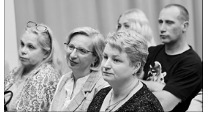
■ Для гостей торжества подготовили концертную программу