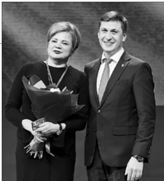
■ Новоиспеченным партийцам торжественно вручали партбилеты на сцене