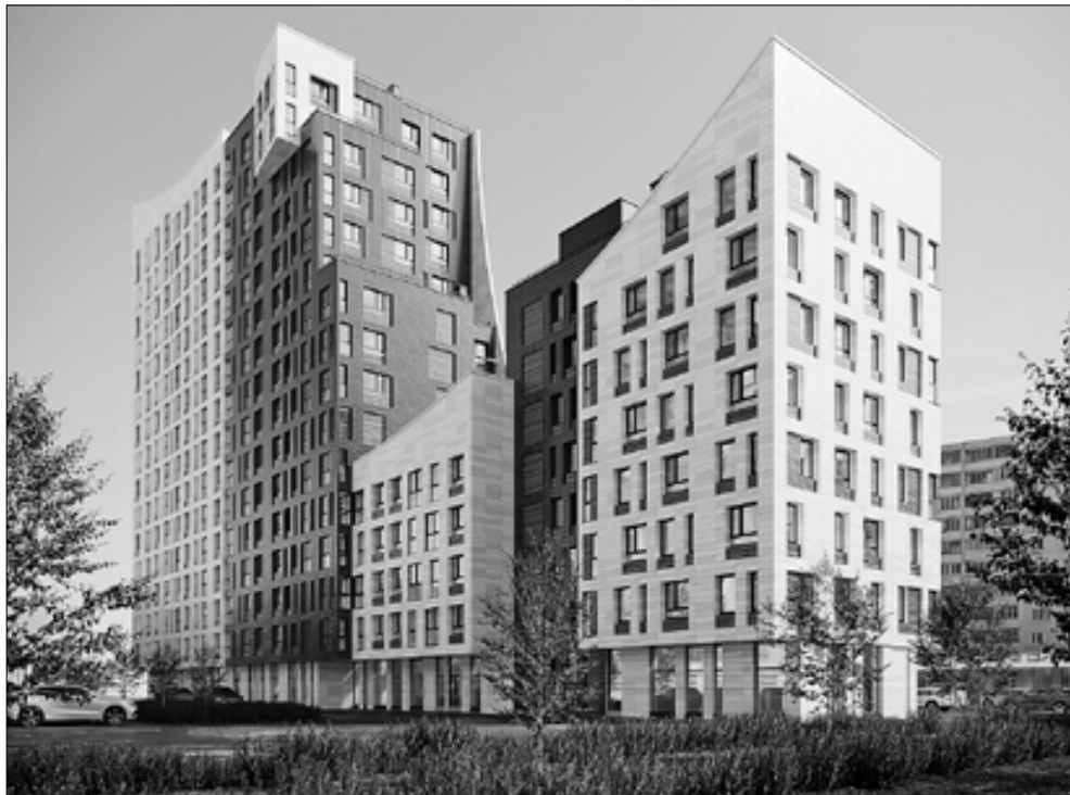
■ Проект ЖК на улице Нагорной в Архангельске

– Помимо непосредственного строительства объектов мы выполняем комплексное благоустройство и озеленение территории в соответствии с действующими градостроительными требованиями, а в ряде случаев и сверх них. Точечная застройка, которая имела место в Архангельске, ушла в прошлое – мы это прекрасно