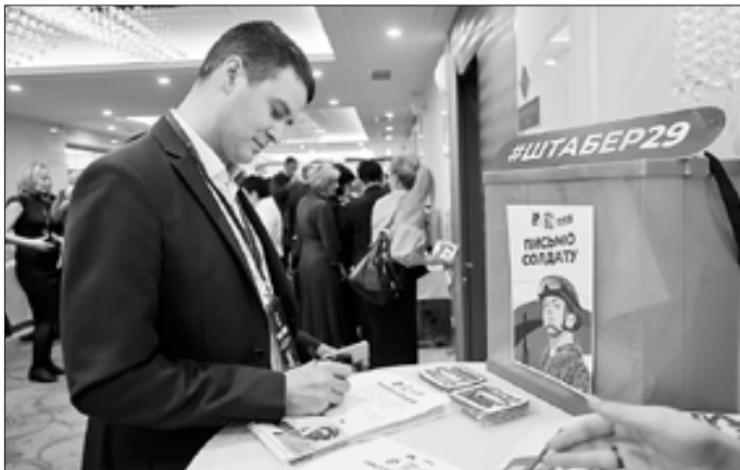
■ Участники конференции могли написать письма поддержки для бойцов в зоне СВО