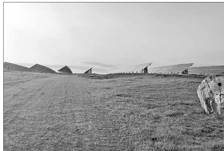
■ На месте рекультивированной городской свалки разбит газон и установлены солнечные батареи.