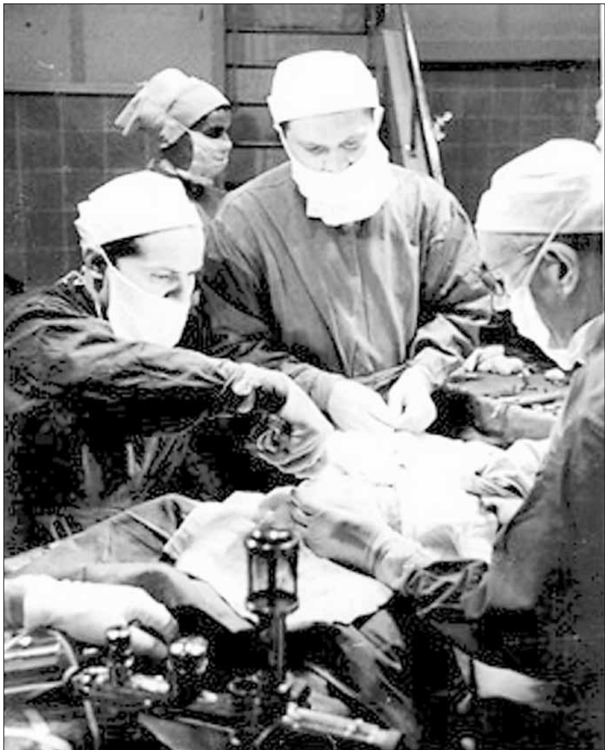
■ Демонстрация трансплантации сердца в клинике в Лейпциге в 1958 году

мировой трансплантологии Владимир Демихов всегда работал в таких условиях