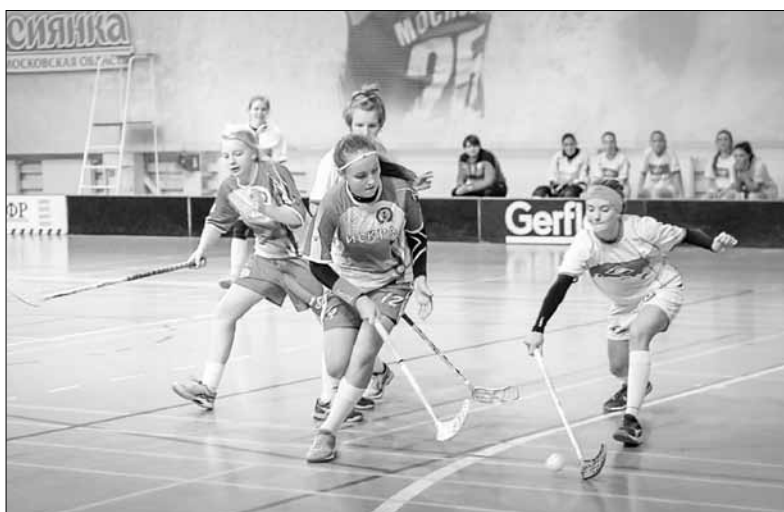
■ В игре юниорки «Искры» и столичного «Спартак».