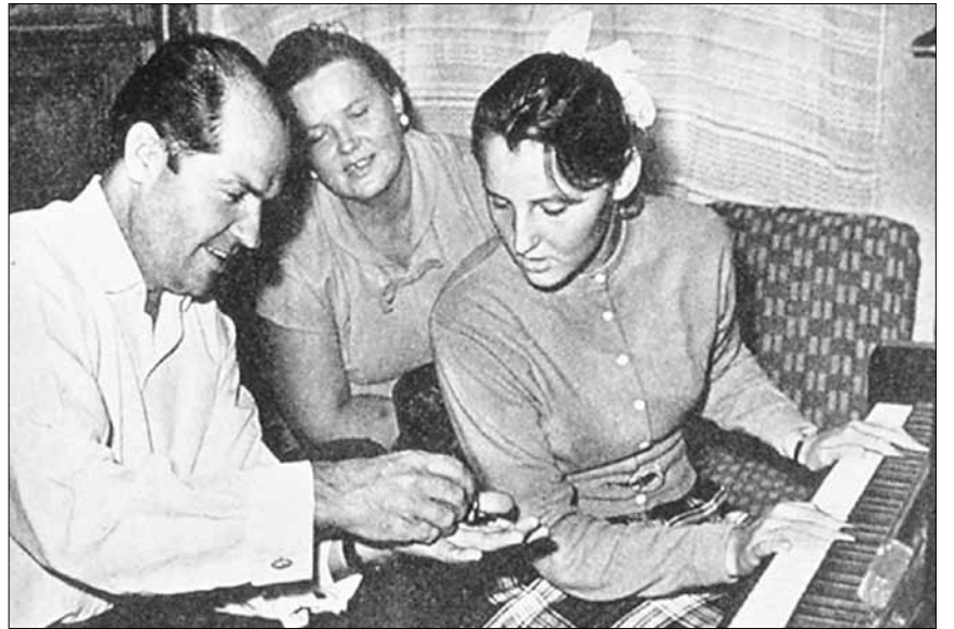
■ Владимир Демихов с женой и дочерью