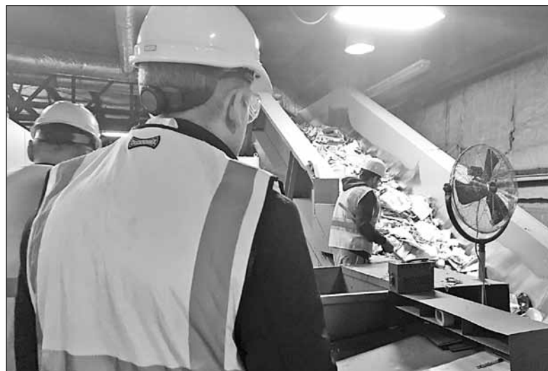
■ Завод «Экомейн» в Портленде оснащен современным оборудованием.