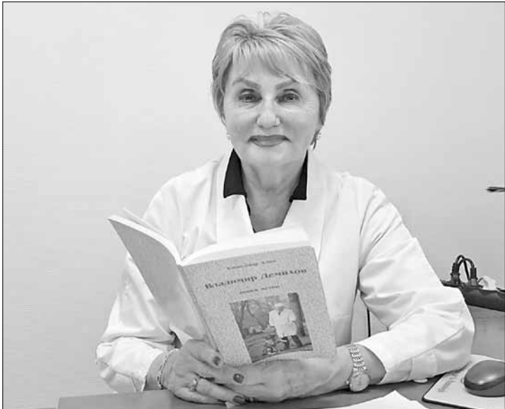
■ Ольга Демихова.

Университет Демихов окончил с красным дипломом и ушел в армию. Было это в августе 1940 года, так что на его плечи выпала сначала