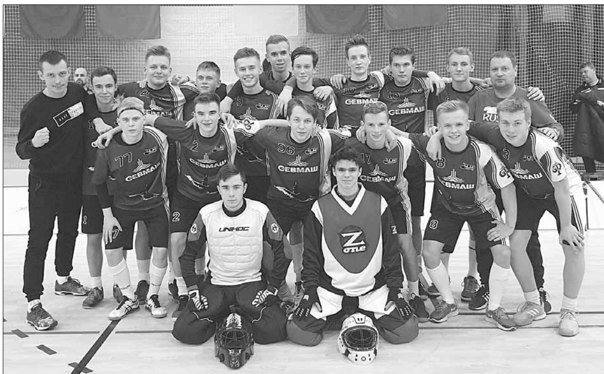
■ Юниоры «Помора».

– Прежде отмечу, что, как и в турнире мужских команд, юниоры сражались на паркете спорткомплекса «Новое поколение». В стартовой игре у «Помора» никаких сложностей не возникло. Встреча с флорболистами Подмоскovie прошла с нашим полным преимуществом и завершилась убедительной победой – 14:1. Следующие матчи сложились несколько иначе. Так, в игре с хозяевами тура из команды «Новое поколение» в первом периоде у ребят были некоторые проблемы, но в двух последующих они полностью диктовали свои условия и вновь праздновали успех – 6:1. Самый сложный поединок выдался у нас с еще одним нижегородским коллективом – «Мининским университетом».