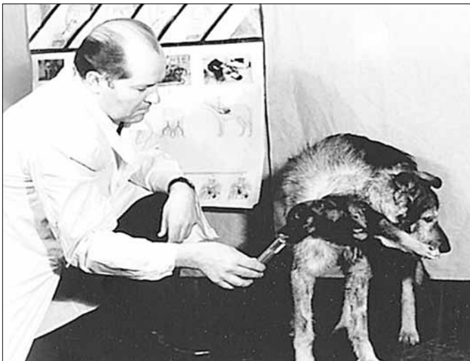
■ Эксперименты Демихова доказали, что пересадка органов возможна

– Бураковский – папин ровесник, и они были дружны. Как-то он приехал к нему после смерти ребенка – он же детей оперировал. И плакал. Большой красивый мужчина со слезами на глазах... Бураковский папе говорил: «Я даже не смотрю детей