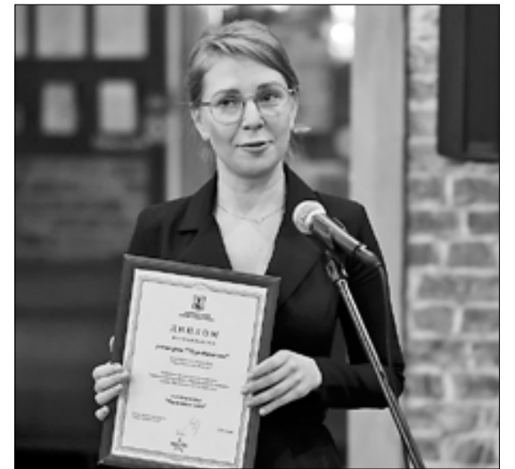
■ Победитель в номинации «Ресторан года» – ресторан «Пур-Наволок»