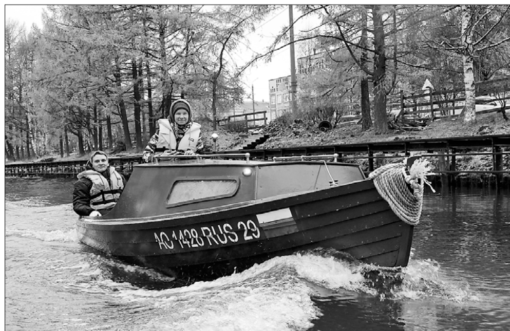
ФОТО: «ПОМОРСКИЙ КОЧ»

Также в ходе заседания было рассмотрено обращение Мезенского дорожного управления. Предприятие готовится к зимнему содержанию дорог. Его специалисты считают, что качественной уборке снега мог бы способствовать перевод светофоров в режим желтого мигающего сигнала в ночное время. Выяснилось, что такой режим можно использовать только на перекрестках, где нет выделенной пешеходной фазы светофора. В качестве эксперимента предложили опробовать его на проспекте Ломоносова: здесь одностороннее движение, две полосы и есть перекрестки без пешеходной фазы. Архтелецентр проанализирует, в какой период ночного времени по проспекту едет меньше всего машин и безопаснее всего вводить режим желтого мигающего сигнала.