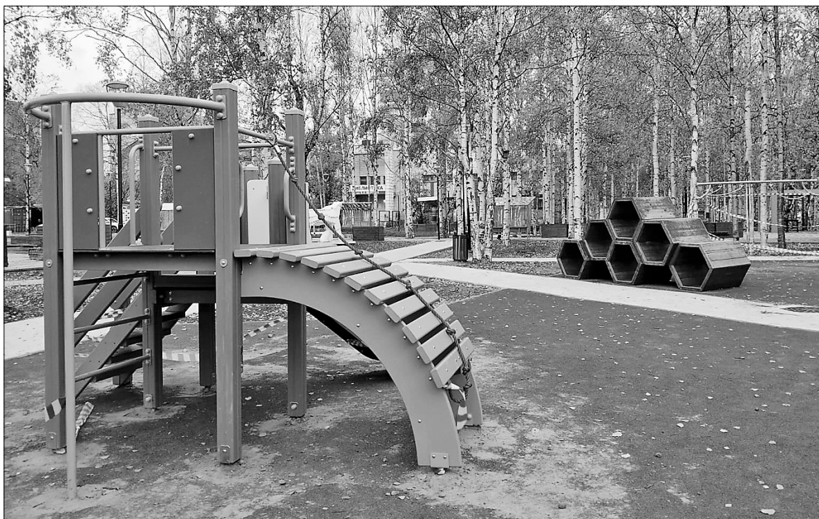
■ Совсем недавно были установлены новые комплексы в Белом сквере. Жители уже высказали пожелания – например, по поводу песочниц

ар, но на проезжей части постоянно лужи.