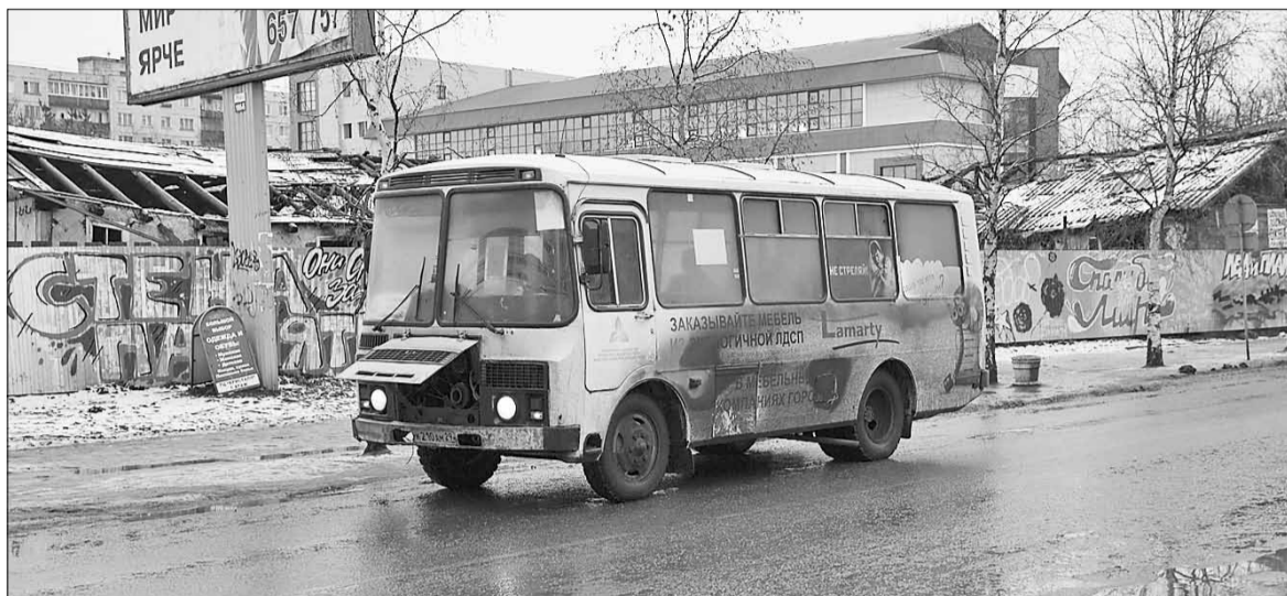
■ Такие автобусы на городских улицах – мера вынужденная.

Также специалисты предлагают возможность организовать новый либо изменить действующий автобусный маршрут через улицу Выучейского: ул. Галушина – пр. Московский – ул. Урицкого (ул. Смольный Буян) – ул. Тимме (ул. Держинского) – ЖД Вокзал – ул. Воскресенская – ул. Выучейского – пр. Ломоносова – пр. Ленинградский – ул. Галушина. Подобный маршрут задействует пропускную способность улицы Выучейского и обеспечит дополнительным транспортом обслуживанием жителей 6-го и привокзального