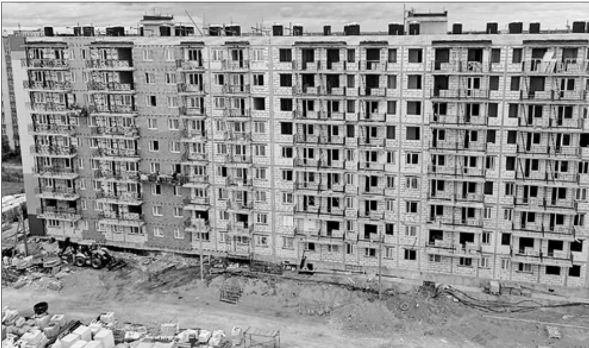
■ С 2020 года в Архангельске построено 19 многоквартирных домов, и еще два – в округе Варавино-Фактория – должны ввести в эксплуатацию до конца этого года. Строительство ведется по программе переселения из аварийного жилья национального проекта «Жильё и городская среда». Жилищные условия смогут улучшить порядка 400 семей, которые сейчас проживают в аварийном фонде. 52 квартиры предназначены для детей-сирот.

Другой инструмент расселения – адресная программа Архангель-