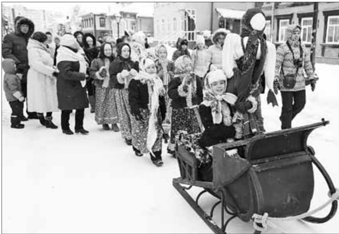
■ Встречаем Масленицу.