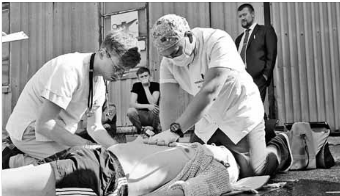
■ Врач – сложная профессия, требующая многогранной подготовки и постоянного совершенствования навыков. На фото – конкурс бригад скорой помощи, состоявшийся в Архангельске в июне.

Помимо целевого приема, для решения кадровой проблемы в Поморье используется компенсационная форма обучения, когда регион или лечебное учреждение выделяет свои средства на подготовку специалистов. Фактически студент учится на коммерческом отделе-