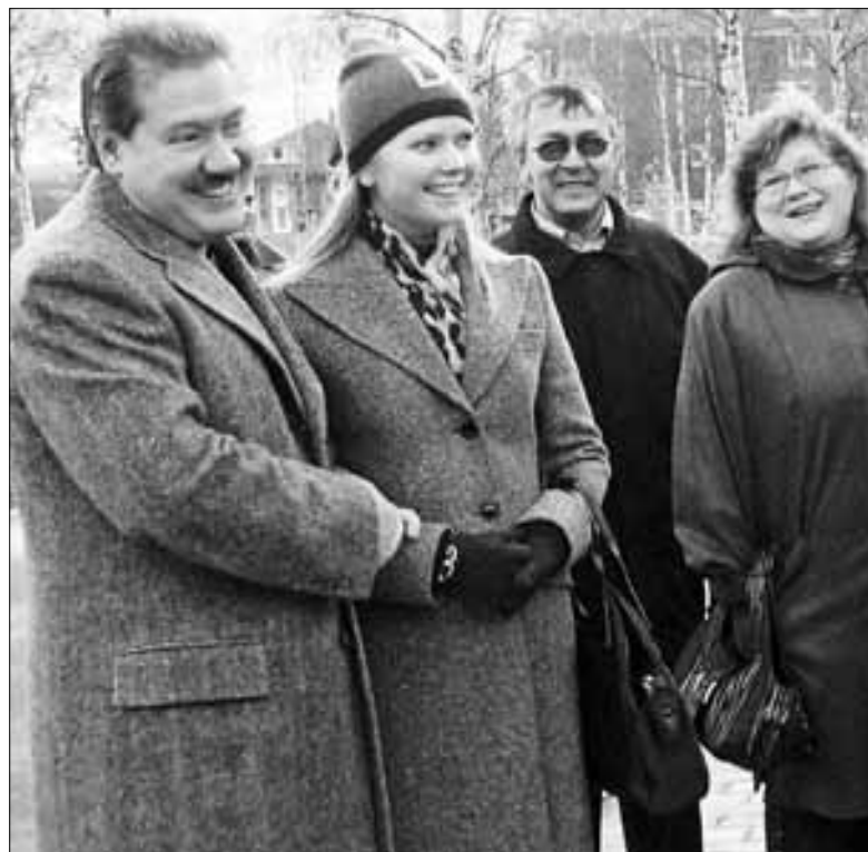
■ Чумбаровка. Открытие после ремонта.