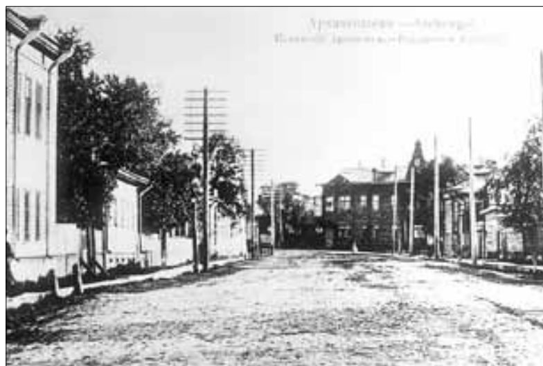
■ Дореволюционный Псковский проспект. АРХИВНЫЙ СНИМОК

Я отлично помню Чумбаровку 90-х: заросшая бурьяном, вся в канавах и рытвинах, непроходимая и непроезжая, заброшенная, напоминающая какой-то окраинный или сельский «заулок». Даже не верилось, что можно одним махом превратить ее в архангельский «Арбат». Но это, слава богу,