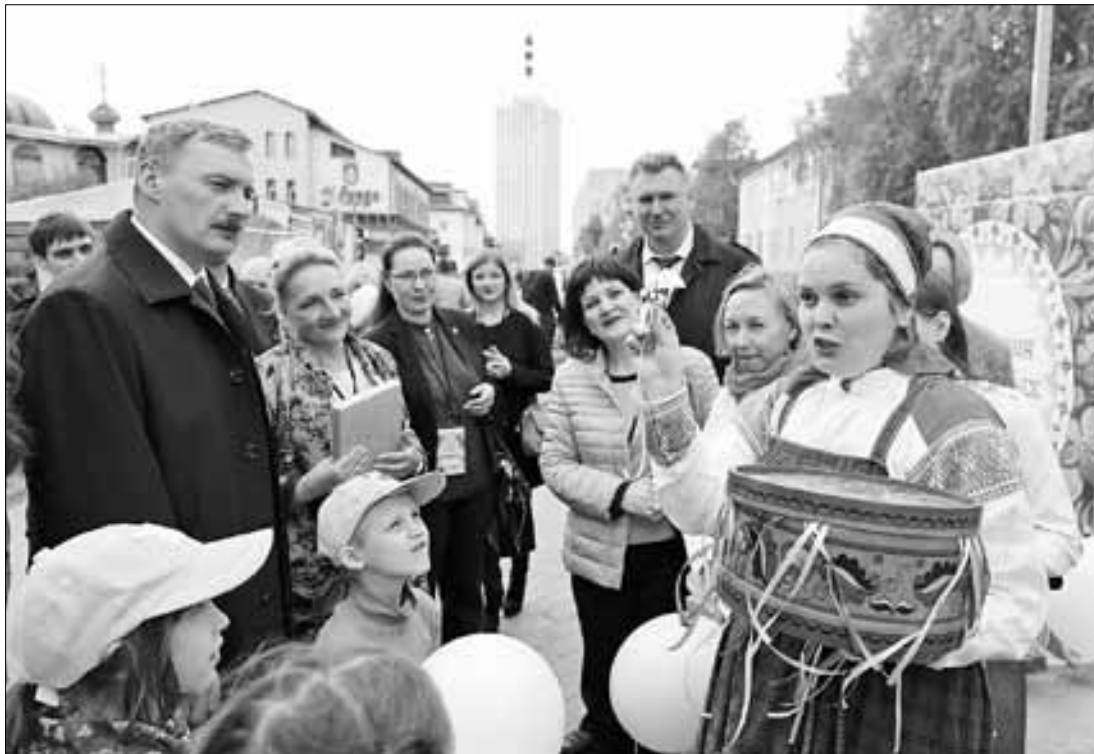
■ Ярмарка мастеров. Наши дни.

сделали из бесхоза чудо под названием Чумбаровка