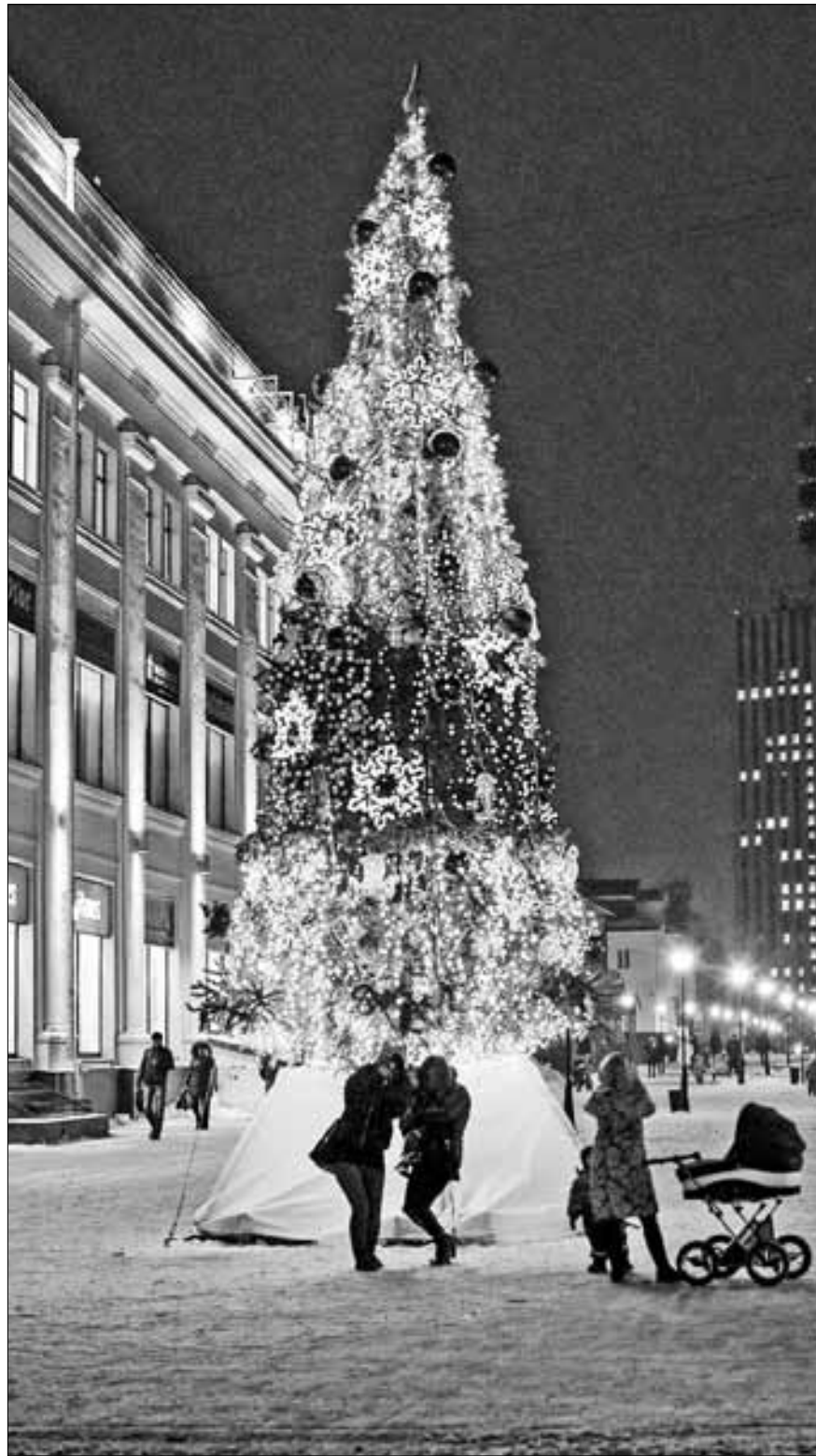
■ Традиционная елка у Центрального универмага.