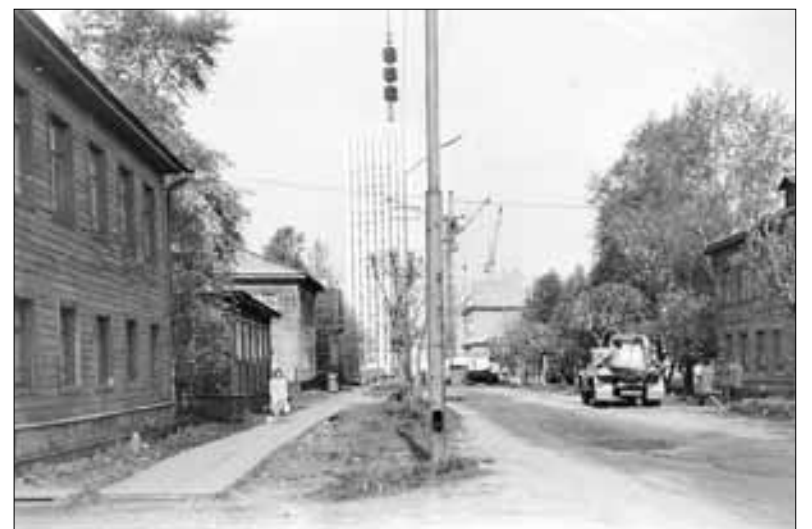
■ Советские годы.