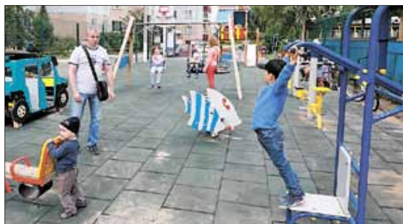
■ Новая детская площадка во дворе домов на улице Галушина, 26 и 28 уже вовсю используется жителями