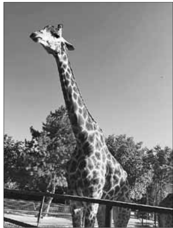
■ В сафари-парке «Тайган» обитает более 50 львов, а также множество других животных. Жирафы будут настоячиво требовать от вас угощения, так что не забудьте захватить для них морковь или бананы

Как ни старайся, обо всех красотах Крыма рассказать не удастся, да и увидеть все за две недели, проведенные на полуострове, невозможно. Ну а на ставший таким актуальным вопрос: «Дорого ли в Крыму?» – у каждого будет свой ответ. Да, порой цены неоправданно высокие, но всегда есть варианты сэкономить. На мой взгляд, единственная значительная трата, за исключением дороги, – жилье. Для сравнения: в прошлом году, отдыхая в Лазаревском, я потратила на эти цели практически в два раза меньше. Единственное, о чем жалею, – что решили на все время отпуска обосноваться в одном городе, не переезжая куда-то еще, ведь в каждом населенном пункте, курортном и не очень, – свои природные богатства, особая атмосфера и завораживающая красота. Но возможно, это повод вернуться, чтобы узнавать полуостров заново, открывать интересные маршруты и снова удивляться тому, насколько многогранен Крым.