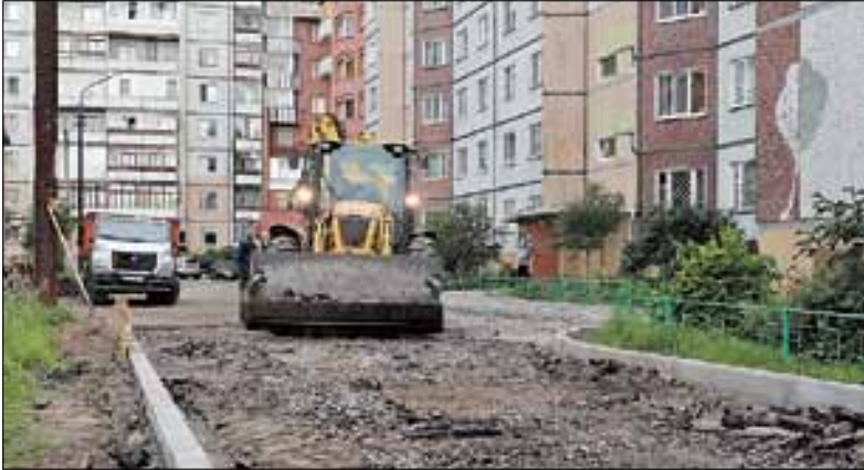
■ Советская, 7, корпус 1: во дворе будет новый асфальт

Игорь Годзиш проинспектировал ход ремонта дворовых территорий