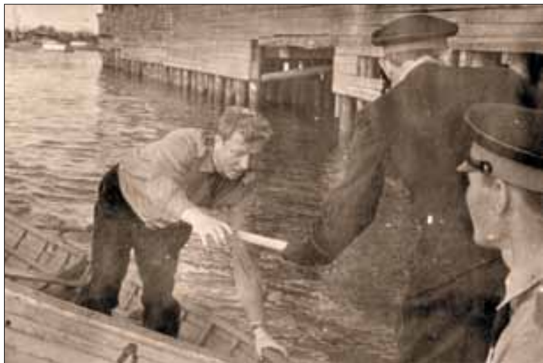
■ Раньше участникам эстафеты приходилось даже грести на лодках.

«Победителем эстафеты стала команда УМВД по городу Архангельску. Это уже их третья по счету победа, теперь переходящий кубок по праву останется в команде не на год, а навсегда»