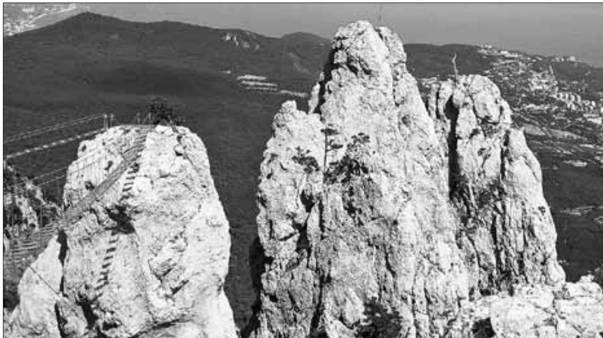
■ Гора Ай-Петри – один из самых узнаваемых символов южного побережья Крыма, место вдохновения, мыслей о вечности и надежд

На протяжении всей набережной множество магазинов, торговых палаток, заведений общественно-