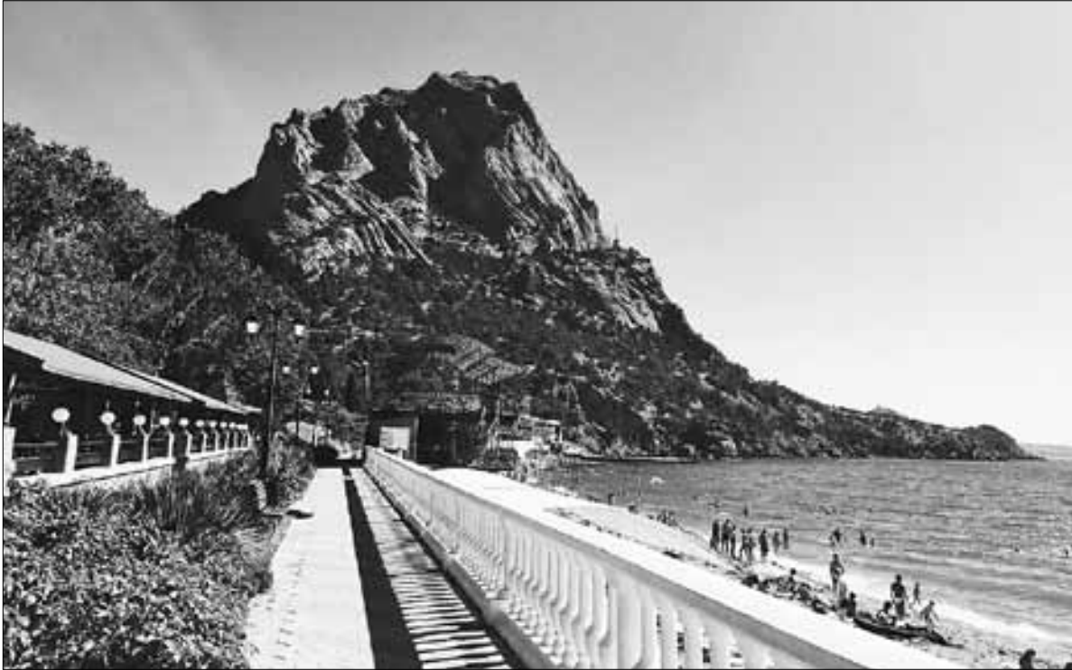
■ Наверное, неслучайно поселок Новый Свет когда-то носил другое имя – Парадиз, что в переводе с английского означает «рай»

и отталкивает туристов полуостров-курорт