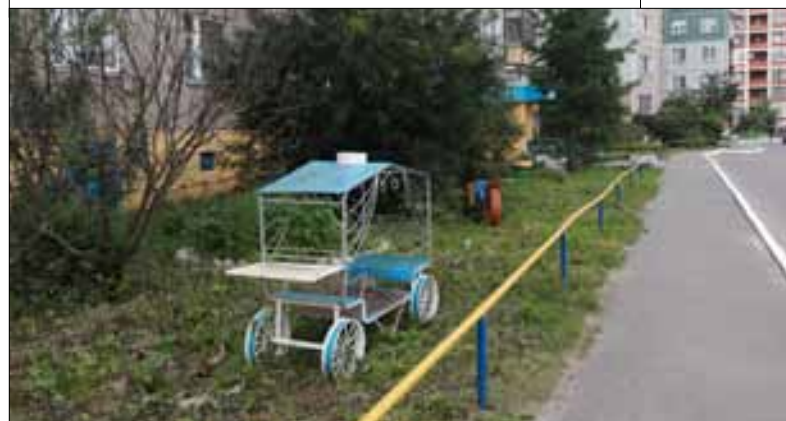
■ Во дворе на Галушина чистота, красота и порядок