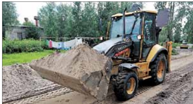
■ На улице Воронина, 43, корпус 1 расширяют внутридворовой проезд

– Всего в этом году в рамках проекта по созданию комфортной городской среды будет приведена в порядок 21 дворовая территория, на эти цели выделено 78 миллионов рублей – это средства федерального бюджета и софинансирование со стороны области и города. Работы идут в графике, каждый объект под контролем как муниципальных, так и самых главных наших заказчиков – людей, которые участвовали со своими проектами в конкурсе. К нам сегодня подходили жильцы других домов с просьбой сделать те или иные работы у них во дворе. Многие пока еще не понимают, что не им делают, а по сути они сами занимаются тем, как будет выглядеть их двор. Человеку должно нравиться место, где он живет. Именно поэтому проект выстроен таким образом и нацелен на поддержку инициативы жителей. Люди собрались, решили, что нужно сделать, подали документы на конкурс, выиграли его и получили то, что хотели. А мы как городская власть им в этом всячески помогаем.