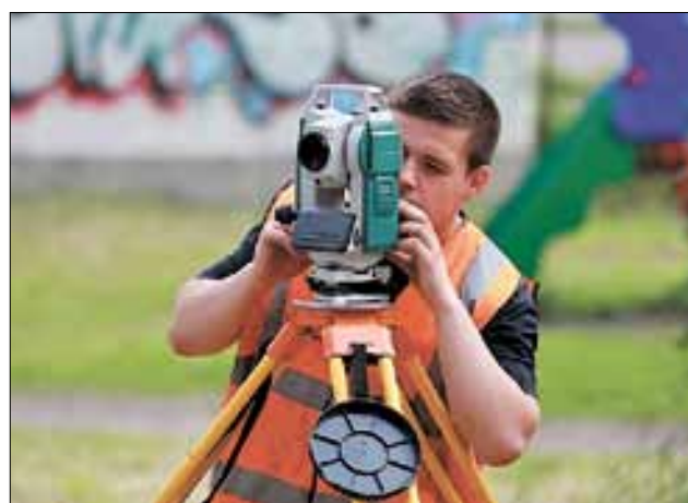
■ Двор на Воронина, 43, корпус 1: к работам подходят профессионально