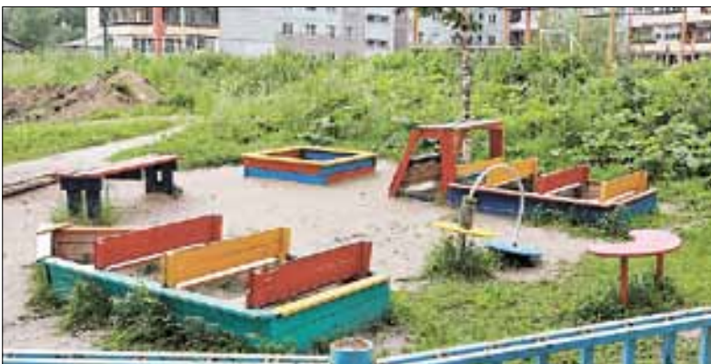
■ Рядом с детской площадкой на Советской, 7, корпус 1 обустраивают целую зону отдыха

– Вдоль дома будет сделан тротуар шириной полтора метра, отделенный от проезжей части бор-