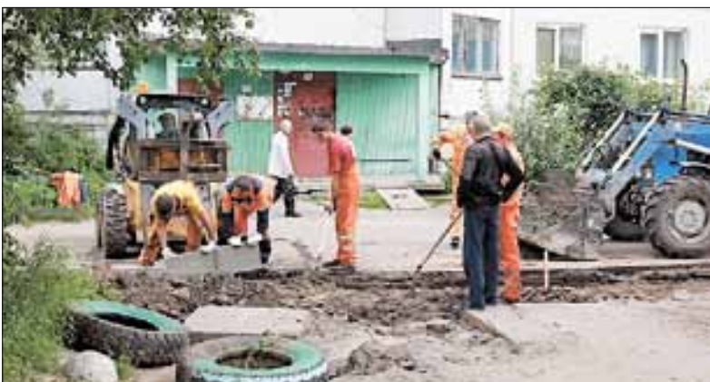
■ На Советской, 19, корпус 1 отремонтируют тротуар, выполнят установку бортового камня и сделают парковку