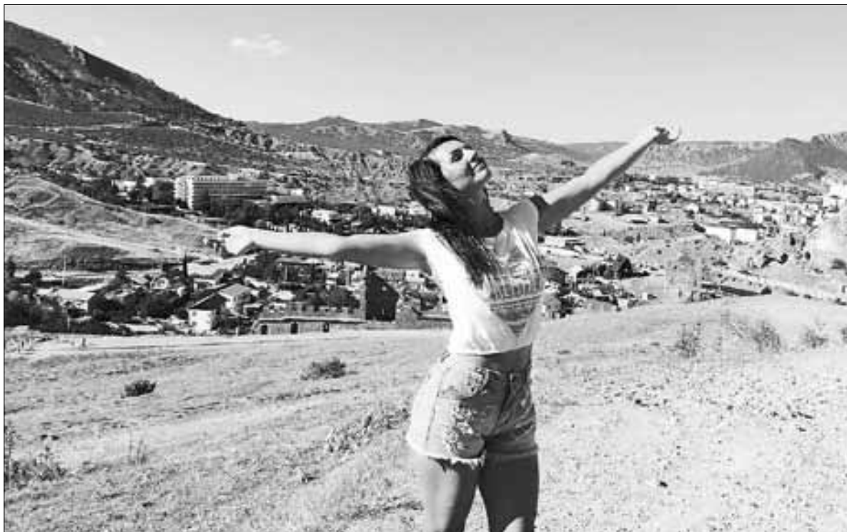
■ Крым поражает своими необъятными просторами, живописными горами и колоритными пейзажами. Здесь все пропитано духом древней истории

И вот позади не радовавший солнцем и теплом Архангельск, а под ногами горячая крымская земля. Среди курортных городов и поселков полуострова мы выбрали Судак. Доехать от аэропорта до Судака или другого населенного пункта можно на такси, и, если желае-