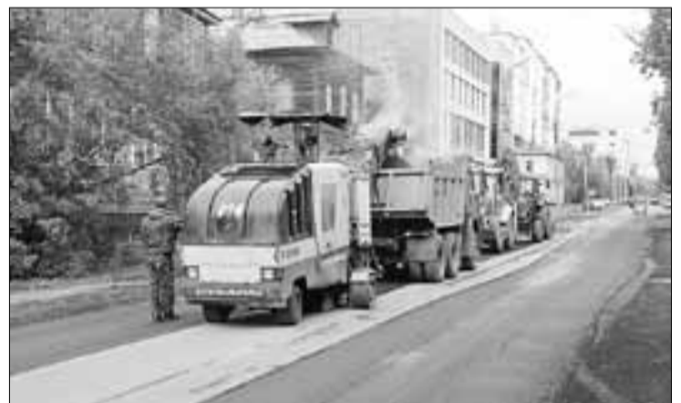
■ Дорожные работы на пр. Советских Космонавтов.

Завершен текущий ремонт участка проспекта Чумбарова-Лучинского от улицы Иоанна Кронштадтского до улицы Выучейского. Компания «АГСУМ» провела фрезерование дороги, уложила выравнивающий слой асфальта, установила 10 люков