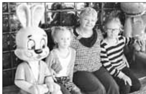
■ Семья Борисовых.