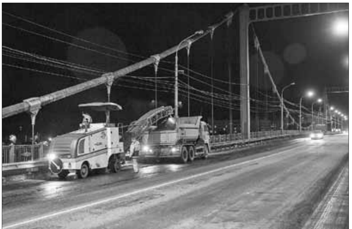
■ На Кузнечевском мосту обновится 5200 квадратных метров асфальтового покрытия.

Подходит к концу и текущий ремонт покрытия Кузнечевского моста. На протяжении 385 метров от Предмостной площади на улице Гагарина до съезда на Советскую завершено фрезерование дорожного покрытия. Укладывается выравнивающий и новый верхний слой асфальтобетона. Всего на мосту обновится 5200 квадратных метров покрытия.