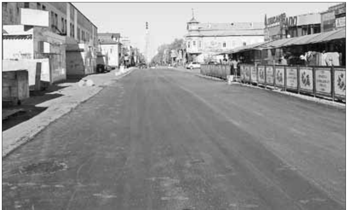
■ Свежий асфальт уложен на пр. Чумбарова-Лучинского от ул. Иоанна Кронштадтского до ул. Выучейского.

За любой победой, конечно, стоит немало сомнений, ошибок и неудач, это абсолютно нормально, естественно. Здесь важно не отступить и не опустить руки, никогда не сдаваться. Главный фактор успеха – это вера в собственные силы, вера в себя. Каждый из вас должен найти себя, достойное место в жизни. Только тогда вы станете сплоченной, хорошо сыгранной, лучшей в мире командой. Я убежден, так оно и будет. За вашими плечами ваши родители, учителя, наставники, ваша Родина – Россия.