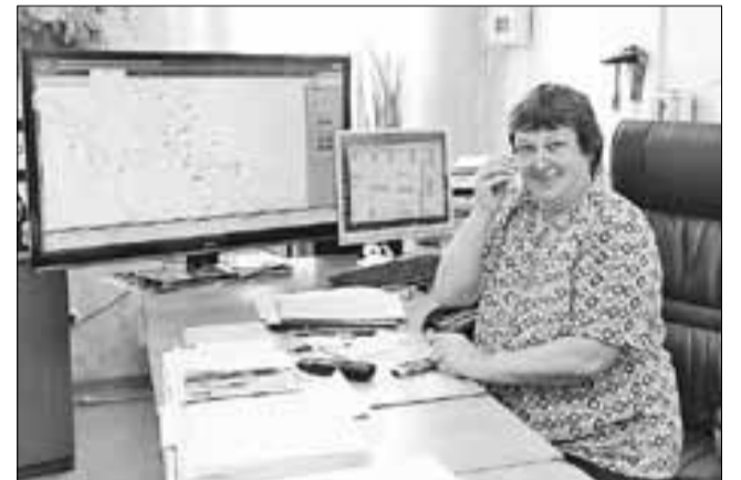
■ ФОТО: ИВАН МАЛЫГИН

Все проводимые МУП «Горсвет» работы – установка новой системы диспетчерского пункта, монтаж новых светофоров, ремонт линий наружного освещения