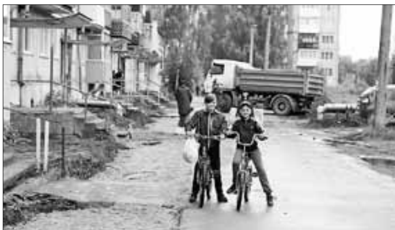
■ ул. Мира, 3/3