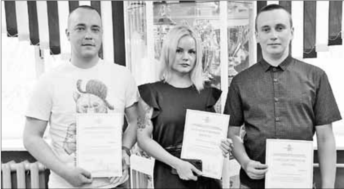
■ Добровольцы оказали неоценимую помощь в поиске самовольно ушедшего из лечебного заведения мужчины.