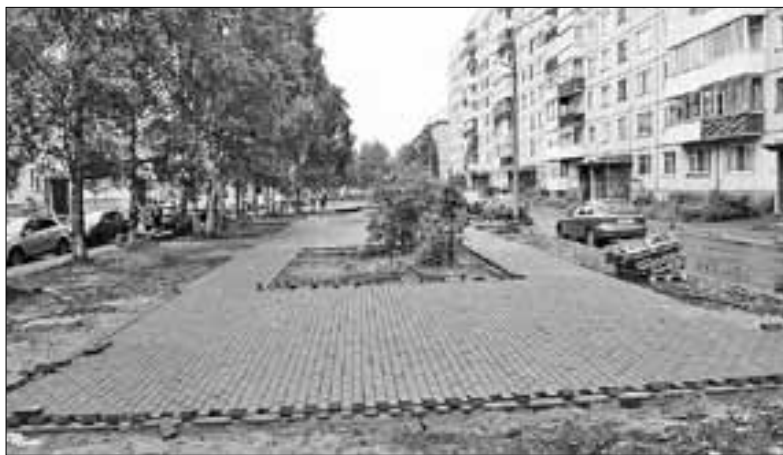
■ пр. Ленинградский, 354 и 354/1