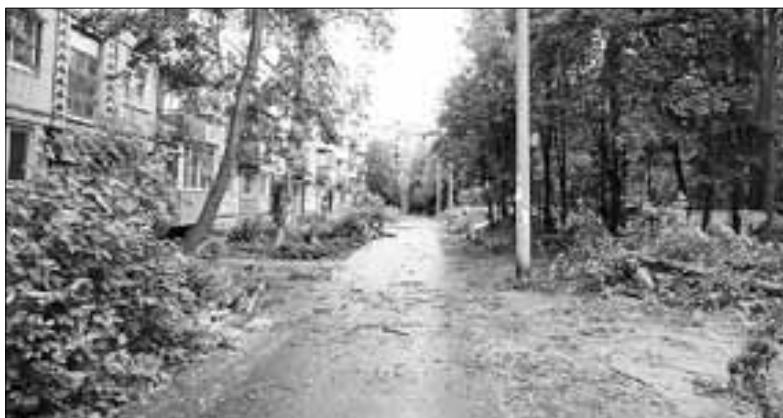
■ ул. Воронина, 31/3

При осмотре двора Игорь Годзиш в первую очередь обратил внимание на необходимость корректировки контейнерной площадки – по проекту она рассчитана всего на два контейнера с отсеком для крупногабарита.