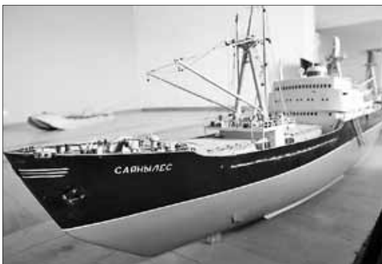
■ На выставке будут представлены и экспонаты времен холодной войны

росом на случай пожара, вызванного разбитой ампулой (только купорос мог потушить смесь).