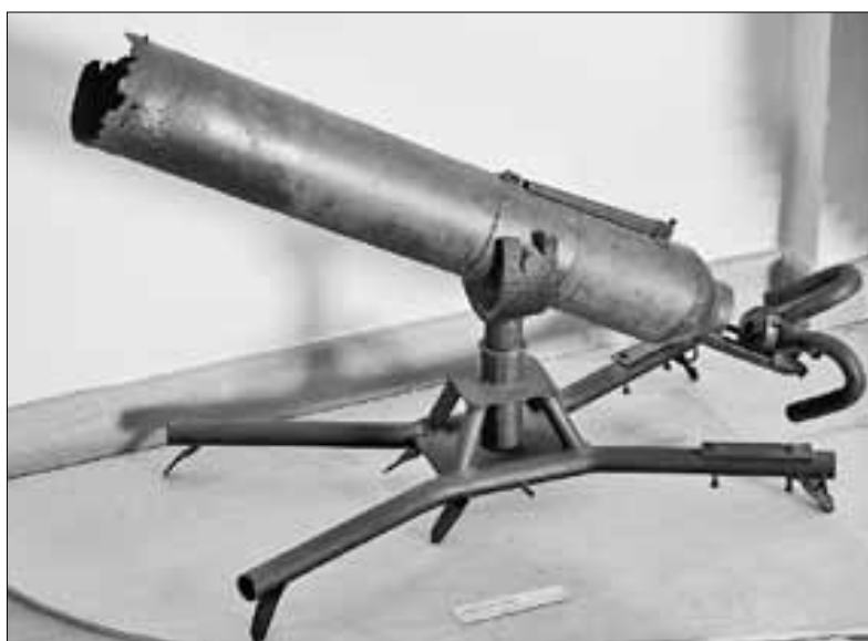
■ Так выглядит ампуломет