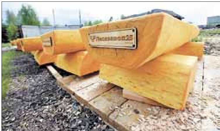
■ Яркие желтые скамейки из дерева с логотипом «Лесозавод 25» как нельзя лучше вписались в зеленый природный ландшафт