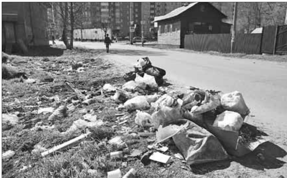
■ Борьба со стихийными свалками может вестись лишь в двух направлениях: убеждение и наказание.

Можно ли найти другой вариант, кроме коллективного контейнера, ведь многим горожанам просто лень донести пакет с мусором до конца квартала? Известно, что существует интересная практика: продажа наклеек со штрих-кодом, которые крепятся затем на объемные пакеты с мусором. Информацию со штрих-кода считывают сканером, и житель платит за вывез-