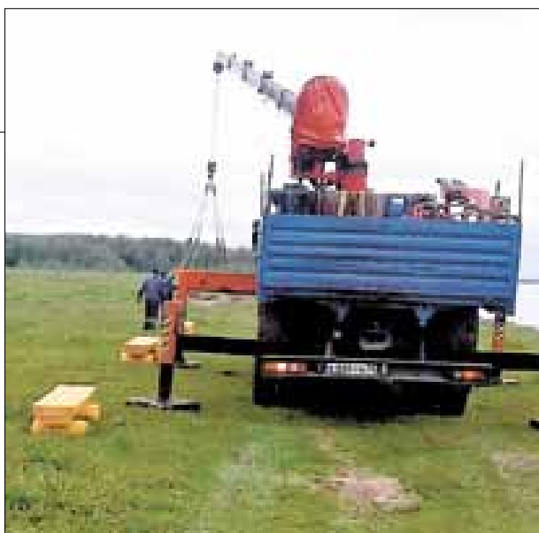
■ Для установки скамеек использовали специальную технику – лавочки, изготовленные из массива дерева, получились тяжелыми