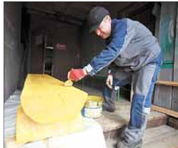
■ Все изделия обработаны специальной пропиткой