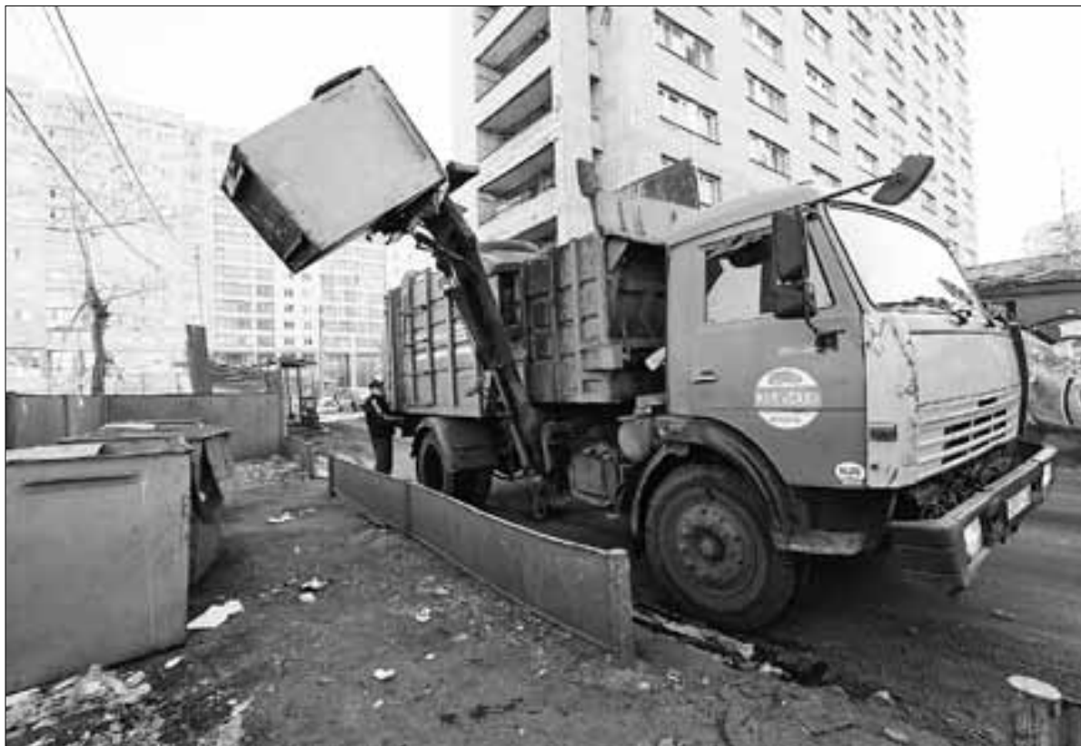
■ Жилищное законодательство обязывает каждого горожанина заключить договор на вывоз мусора.

– В настоящее время лишь 30 процентов доли рынка вывоза мусора принадлежит МУП «САХ». Есть и договоры с ответственными собственниками частных домов. Как правило, соседи 10-15 домов догово-