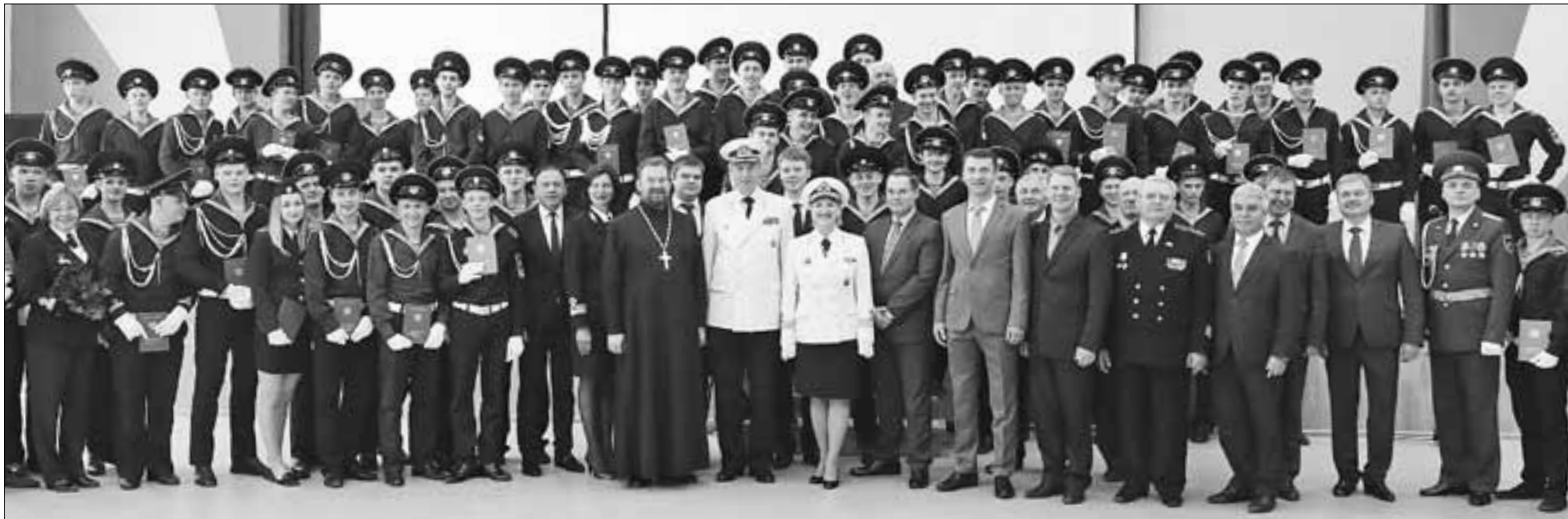
ФОТОРЕПОРТАЖ: ИВАН МАЛЫГИН