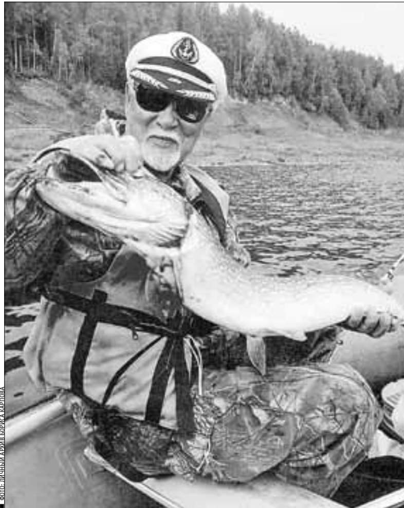
ФОТО: ЛЮБЫМЫ АЖИЯ БЕБИНА, АРХАНГЕЛЬСК

С приходом мирного времени началась трудовая жизнь. В 1952 году