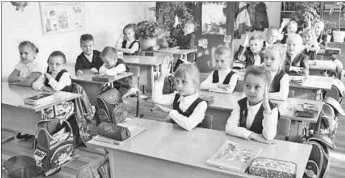
■ Доброжелательная атмосфера в школах – залог успешной учебы ребенка.

Насилие и жестокое обращение, пренебрежение нуждами детей в настоящее время считается одной из важнейших проблем общественного здоровья и ведущей причиной детского травматизма и детской смертности, асоциального поведения детей, нарушения психического, личностного и физического развития.