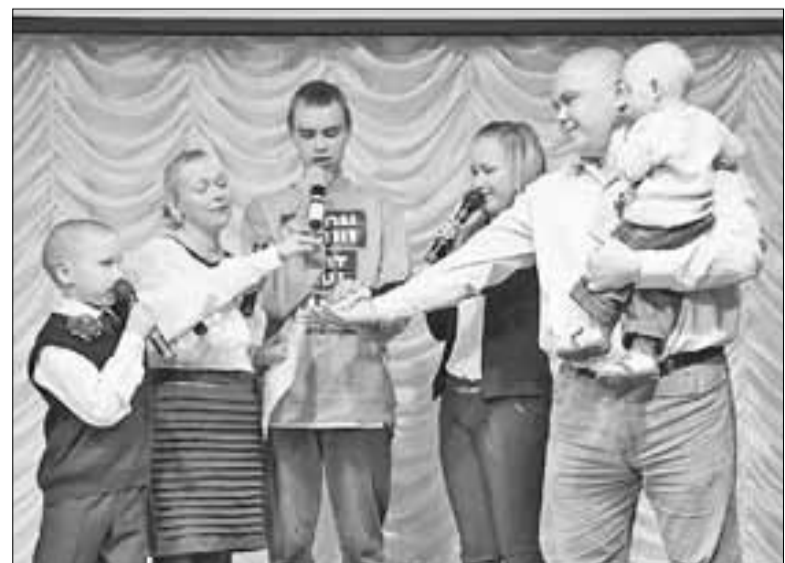
■ Дружные архангельские семьи – активные участники городских творческих конкурсов.

У нас еще много работы по защите прав детей на счастливую жизнь. И для этого городские власти прилагают значительные усилия и вкладывают материальные средства. Я благодарю руководителей и специалистов органов мэрии, городские структуры, учреждения и ведомства за партнерство во имя ребенка.