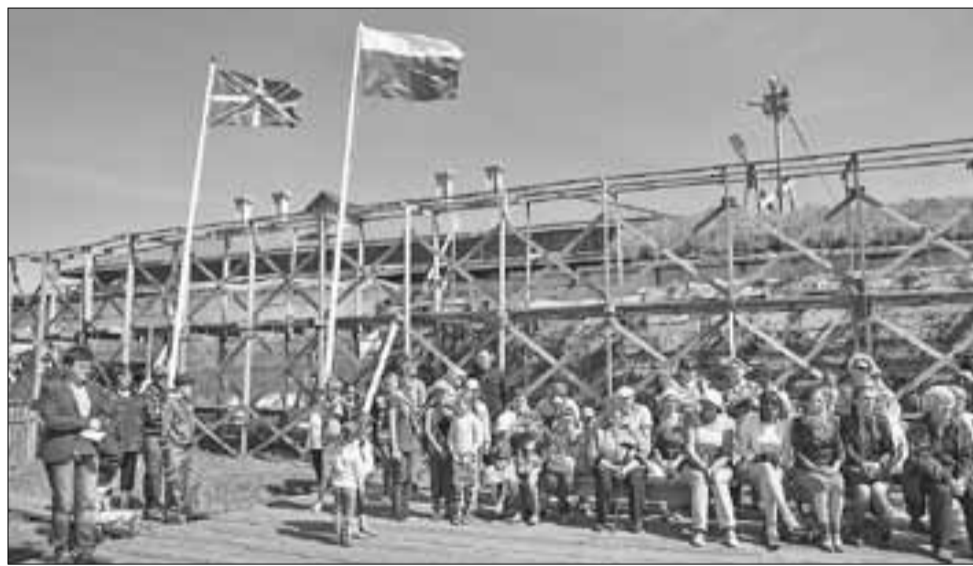
■ Все желающие смогут отправиться на небольшую ознакомительную экскурсию по территории памятника.

Событие: 12 июля легендарная Новодвинка будет встречать гостей