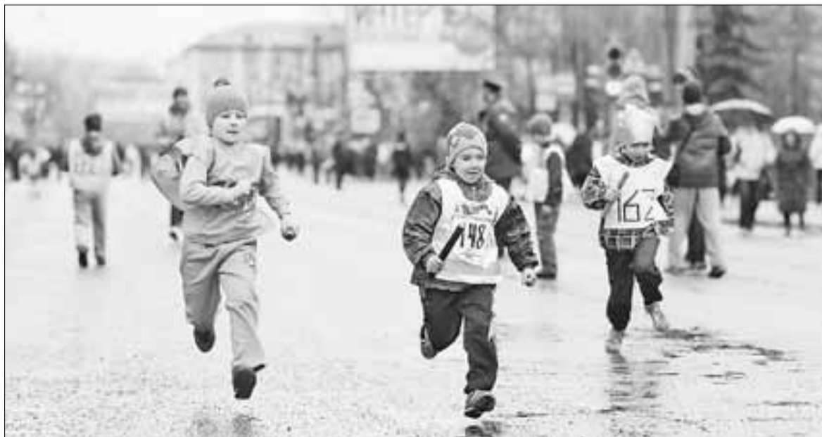
■ Дети – активные участники всех спортивных соревнований.

Формы работы: групповое обсуждение проблем воспитания детей, совместная деятельность родителей и детей, тренинги, лекции специалистов по заявке родителей и пр. В рамках «Родительского кафе» один раз в месяц проводились семейные встречи на базе библиотеки имени Гайдара (23 встречи). Опыт работы с замещающими семьями в рамках «Родительского кафе» стал уникален не только для России, но и для Германии, родины данного проекта.