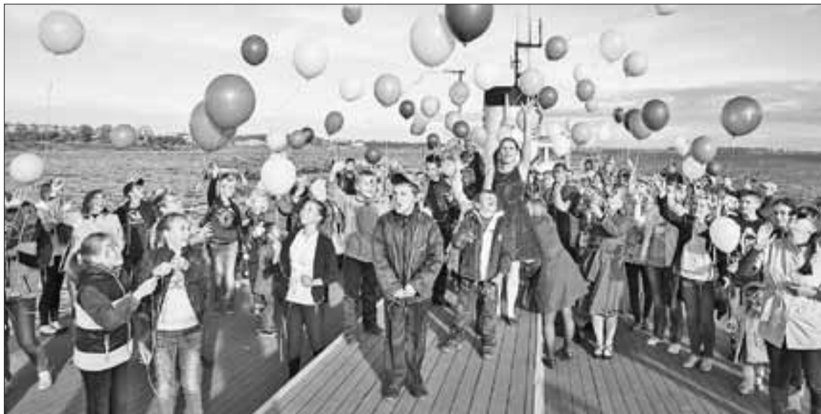
■ Каждый год приемные семьи становятся участниками праздника «День аиста».

Организация этой работы в системе позволит сократить количество изымаемых из семей детей и родителей, лишенных или ограниченных в родительских правах, снизит эскалацию семейных конфликтов.