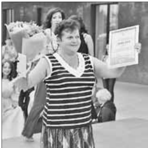
■ Представители детского сада № 84 «Сказка»