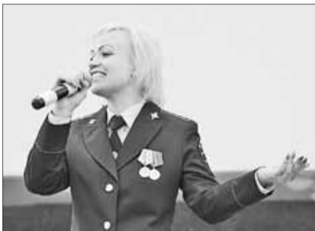
■ Участница ВИА «Ночной патруль» УМВД России по Архангельской области

Кроме того, были отмечены дипломами творческая группа детского сада № 84 «Моряночка», творче-