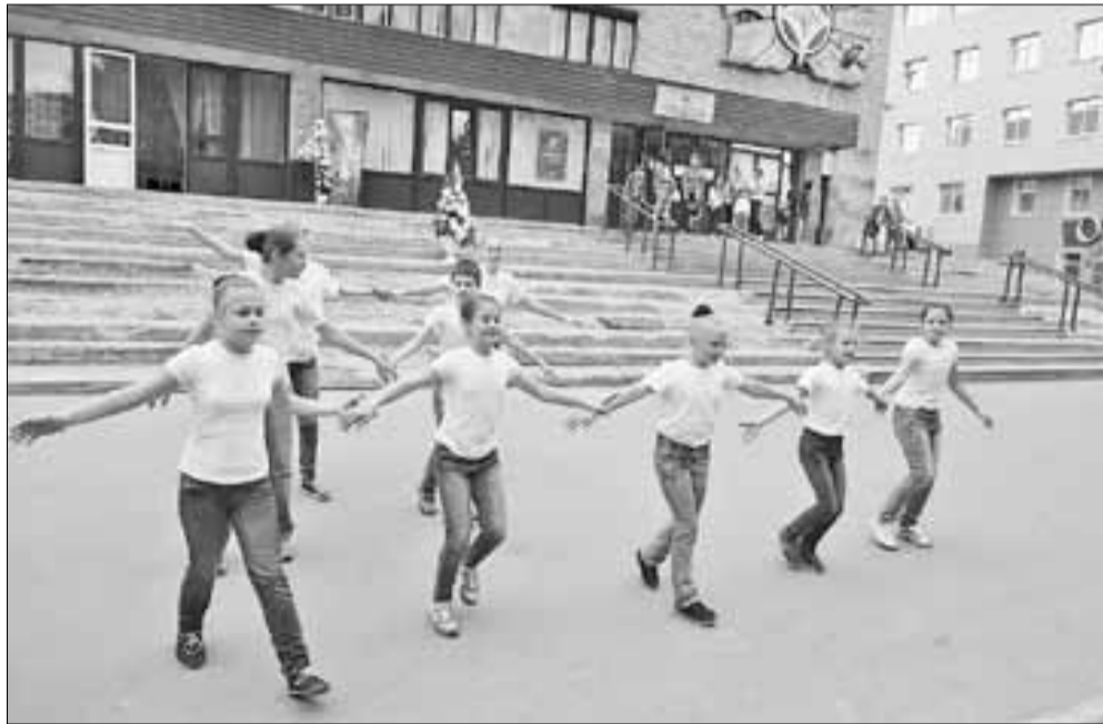
■ Большая работа с детьми ведется в культурных центрах.