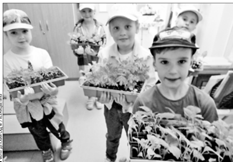
ФОТО: ДЕТСКИЙ САД № 7 «СЕМИЦВЕТИК»

Цветы, посаженные ребятами с любовью и старанием, несомненно, станут украшением территории детского сада, и все смогут любоваться их красотой и цветением все лето.