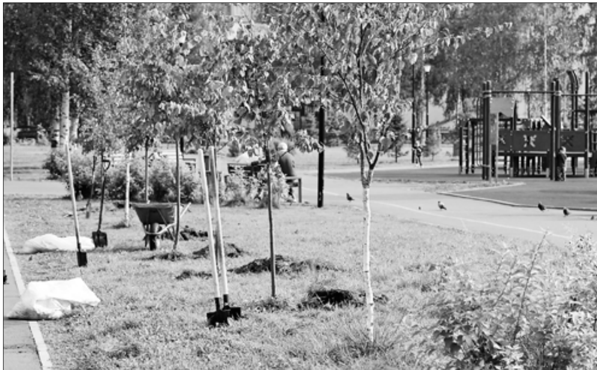
■ В Ломоносовском округе в парке «Зарусье» в прошлом году высадили липы

– Неприятные инциденты. Но что тогда относится к гарантийным случаям?