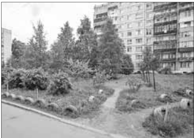
■ Ухоженный двор дома № 23 на Смольном Буяне.