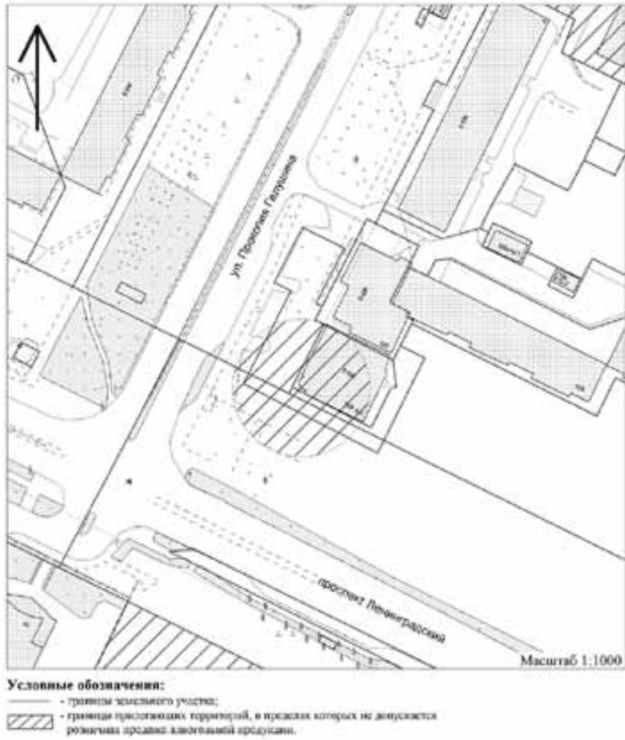
Схема № 174 границы прилегающей территории медицинской организации, расположенной по адресу: Архангельская область, г. Архангельск, пр. Ленинградский, д. 109, корп. 2

Приложение № 3 к постановлению мэрии города Архангельска от 07.04.2014 № 278