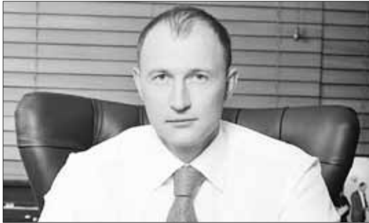
■ Депутат Госдумы Михаил Старшинов