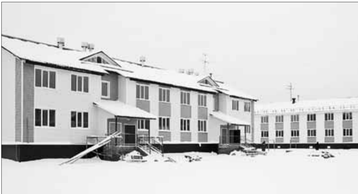
■ Новые дома на Конзихинской.

– Условия предоставления финансирования были очень жесткие, однако именно Архангельск приложил все усилия для их выполнения. Прежде всего это касалось норматива по доле частных