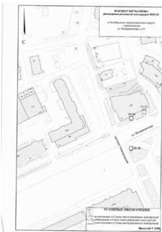
Схема размещения рекламных конструкций на территории муниципального образования «Город Архангельск»