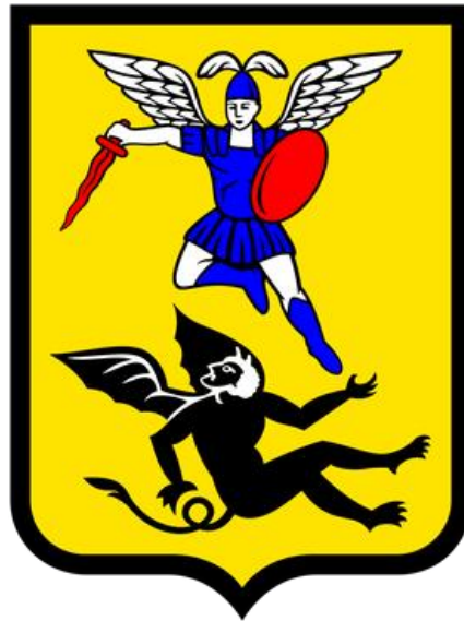
Схема теплоснабжения Муниципального образования городской округ «Город Архангельск» до 2040 года