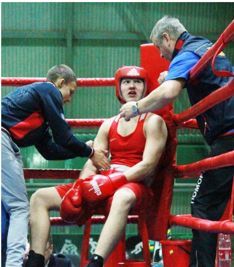
Тренер и боксёр — единая команда