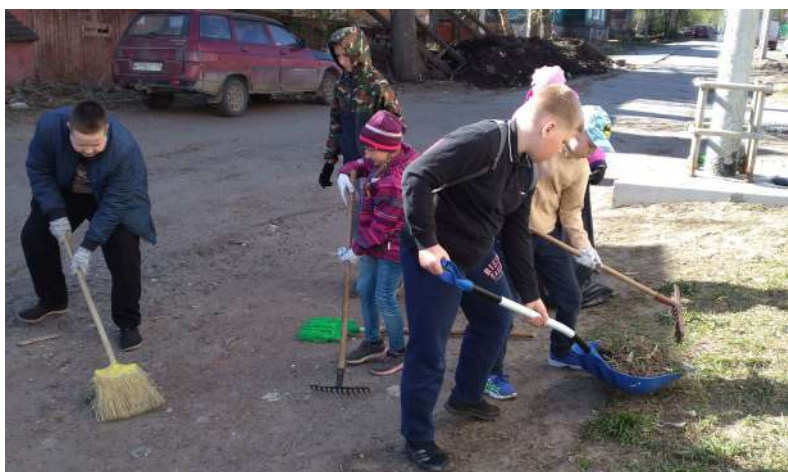
Чистота в городе зависит от нас

Идея развития волонтерства в Доме творчества возникла после первой акции, которая прошла по инициативе учащихся мастерской «Деревянная сказка». Ежедневно ребята из окна своего кабинета наблюдали, как взрослые выбрасывают мусор в неполюбованном месте. Когда сил терпеть не осталось, они предложили изготовить плакат, в котором обратились к людям: «Нам не всё равно, чистая ли у нас улица. Нам не всё равно, какой у нас город». Ребята установили свой баннер, а «машина добра» начала своё движение. Так родилась