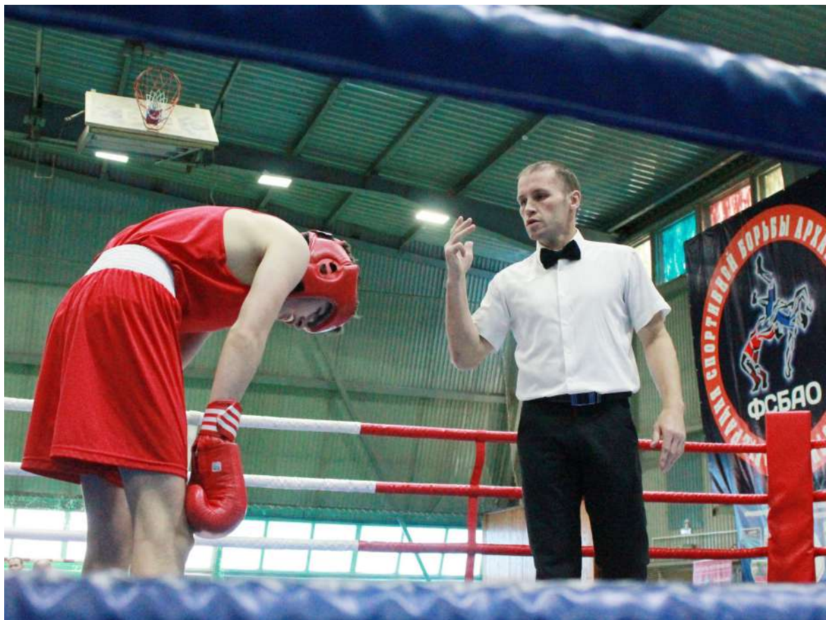
Держись и не сдавайся!