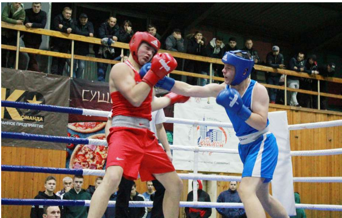
Не пропускай удар, защищайся!