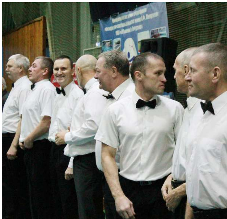
Отряд рефери готов к поединкам