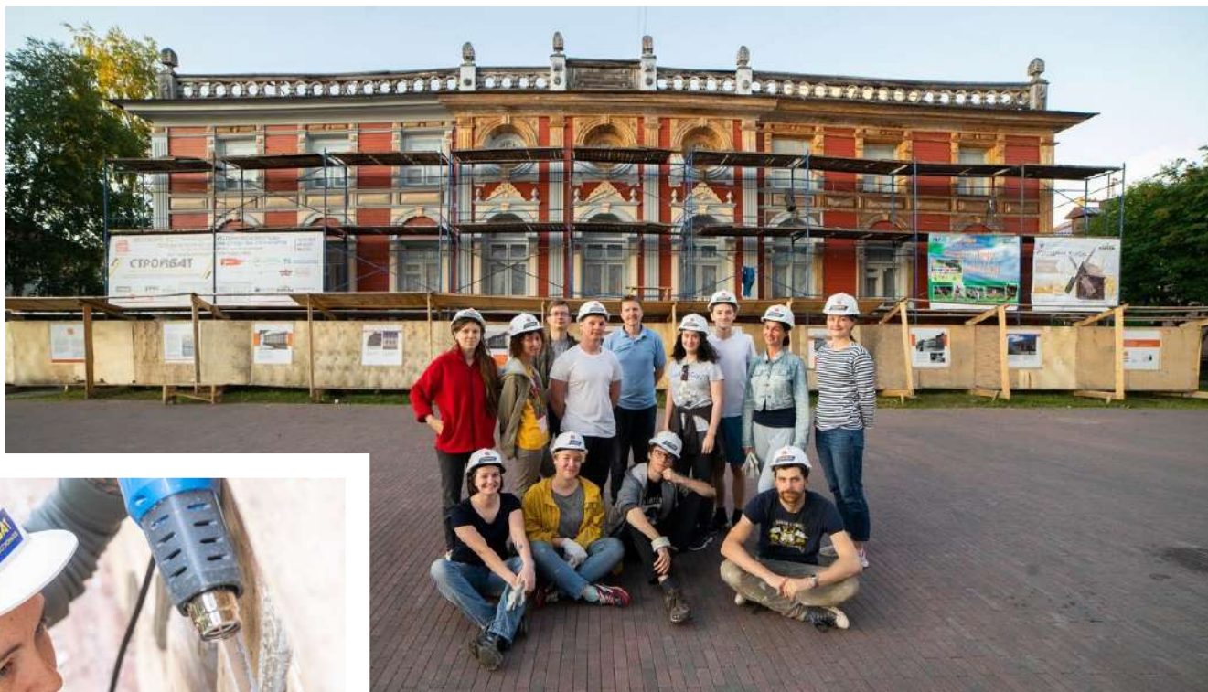
Многие волонтеры впервые в жизни взяли в руки строительные инструменты. И у них всё получилось!

— По моим наблюдениям, в основном приходили люди 25—35 лет. Это либо взрослые люди, которые только окончили университет, и у них ещё нет маленьких детей