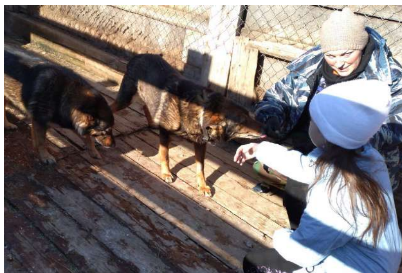
Ребята вместе с педагогами привозят корма в собачий приют

Так как кружковцы часто приходят на занятия раньше нужного времени, для них решили организовать акцию «Книготорг»: учащиеся стали приносить из дома уже