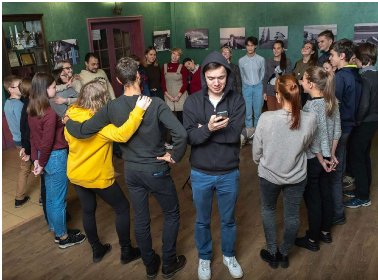
Во время трёхдневного воркшопа мы нашли новых друзей

На третий день у нас была самая яркая и насыщенная программа. Мы научились сами делать мультфильмы!