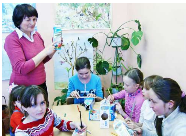
Клуб «Юный эколог», 2003 год