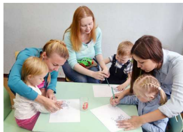
Семейный центр «Растем вместе», 2017 год