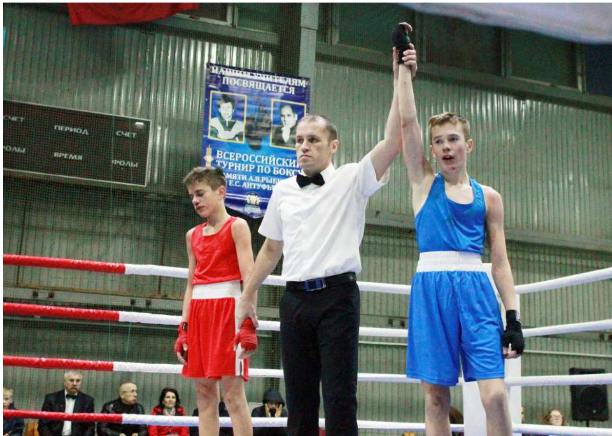
Две стороны одного боя